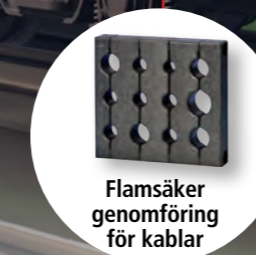
Flamsäker genomföring för kablar