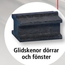
Glidskenor dörrar och fönster