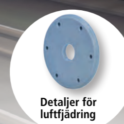
Detaljer för luftfjädring